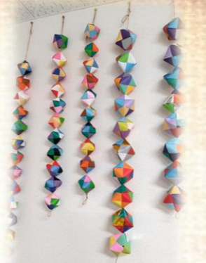
真備地域生活支援センター 『折り紙キューブのれん』