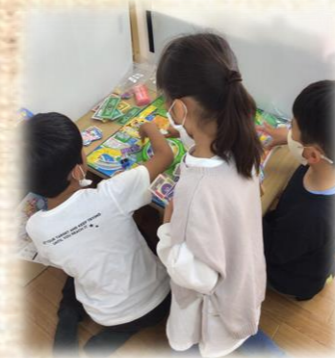
Withひろば早島 『人生ゲームをしたよ』